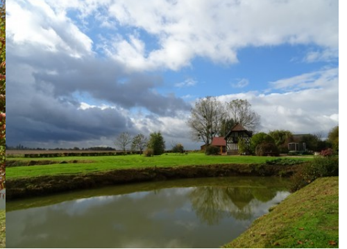
La vue vers le Nord-Ouest

Pour la zone en rose foncé dans le périmètre de 500m