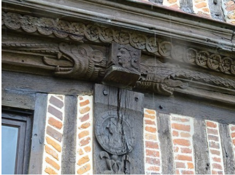
Un détail des sculptures sur bois