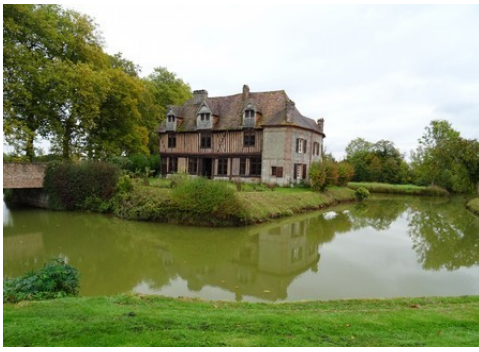
Le manoir et les anciennes douves