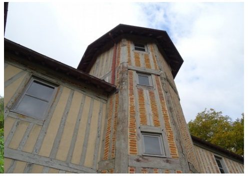
La tour d'escalier polygonale