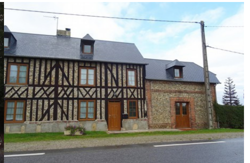
Une maison à pans de bois et tuileaux