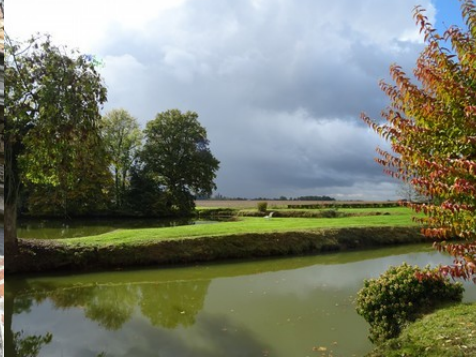
La vue vers les champs à l'Ouest