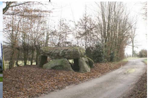
Le dolmen de Verneusses (classé)