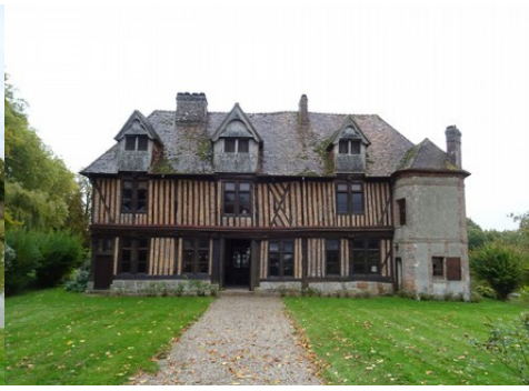
La façade ouest du manoir