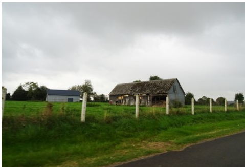
Le bâti rural avoisinant

Les avis seront cohérents avec ceux émis ces dernières années, à savoir : pas de maisons à volume compliqué (type V, W, Y, ou Z), pentes à 45° pour les volumes principaux, ardoise ou tuile plate de teinte brun vieilli, à 20u/m 2 , avec un débord de toiture de 20cm, enduit de teinte beige clair avec modénatures (au choix : chaînages, encadrement de fenêtres, soubassement, colombage...). *Voir les autres fiches.