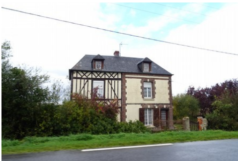
Quelques maisons dans les abords