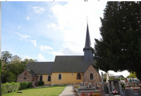
L'église de Verneusses